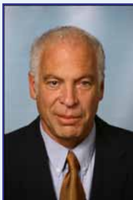
ח"כ אורי אריאל