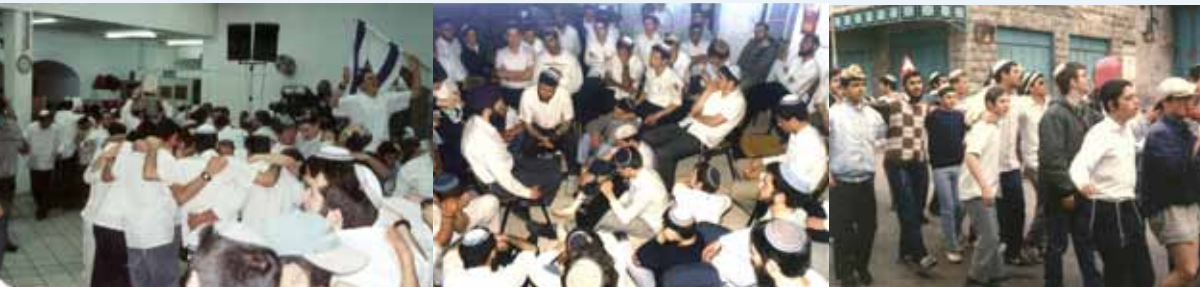
"עדלאידע" בחוצות חברון, פורים תשמ"ח סעודת שושן פורים בחדר האוכל בישיבה